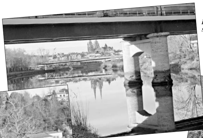
Le Pont Blanc sur la Nive.