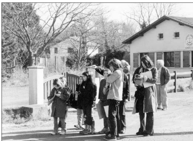
La maison des marins "Escale Adour".