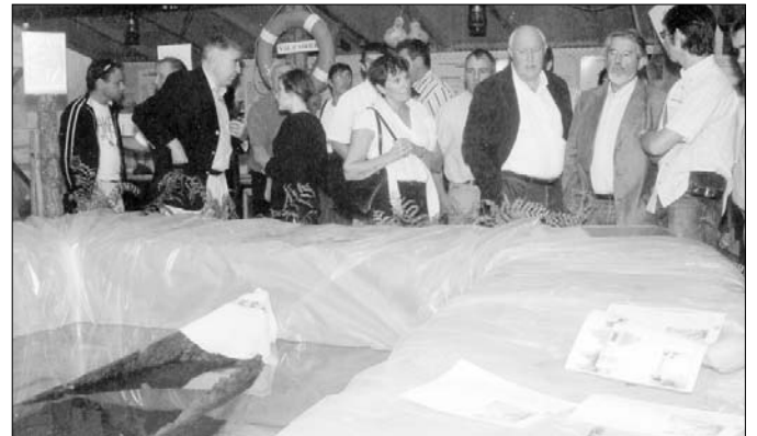
Piscine... pour pirogue.

Le dernier samedi d'août (le 26 en 2006) se déroule le Comice Agricole de Sainte-Marie-de-Gosse doublé d'une Foire Artisanale. Ce traditionnel rendez-vous a toujours autant de succès et cette année les organisateurs ont renforcé le coin "culturel" de la Foire. Un bon tiers du trinquet était réservé à l'Adour au sens large : stand sur la pêche, maquettes de bateaux, le Kural (couralin à voile) et son petit frère... et clou du spectacle : une des cinq pirogues monoxyles trouvées en 2005 au fond de l'Adour était là (exposée dans une piscine de fortune ; pour préserver le bois immergé depuis des siècles).