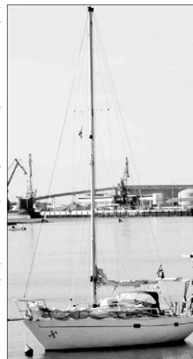
L'Agur" au Boucau.