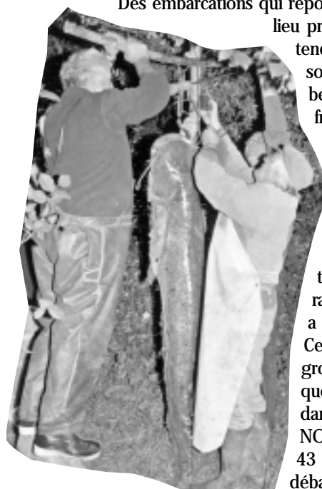
La pesée (difficile) du silure de 70 kg et 2 m de long...

Des embarcations qui reposent aujourd'hui en un lieu précis de l'Adour, en attendant (ou espérant) leur sortie définitive !