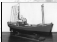
Bateaux voile-aviron Monotypes et voiliers