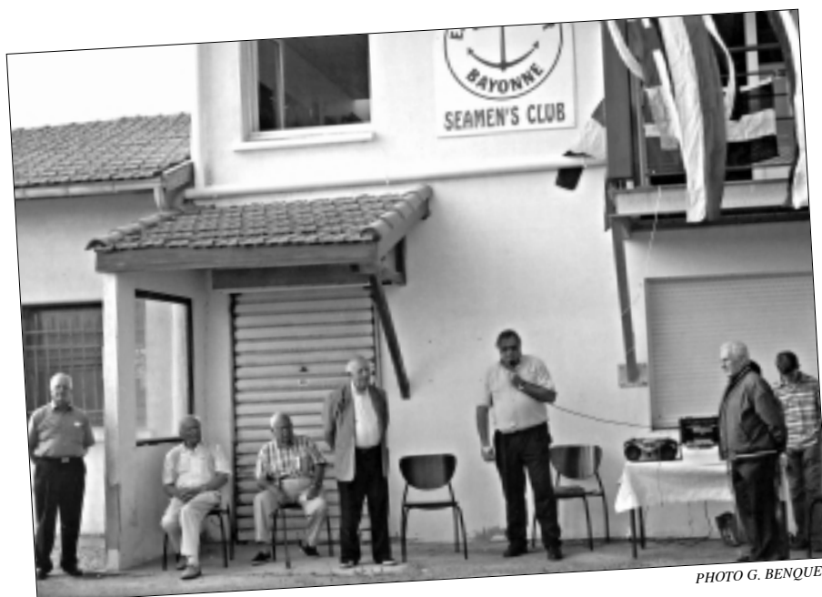
Inauguration du nouveau local d'Escale Adour.