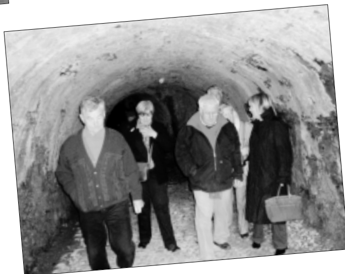
Intérieur de la Grange batelière ou cryptoportique