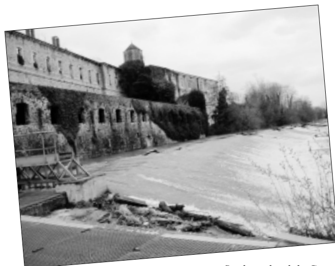
Sorde au bord du Gave