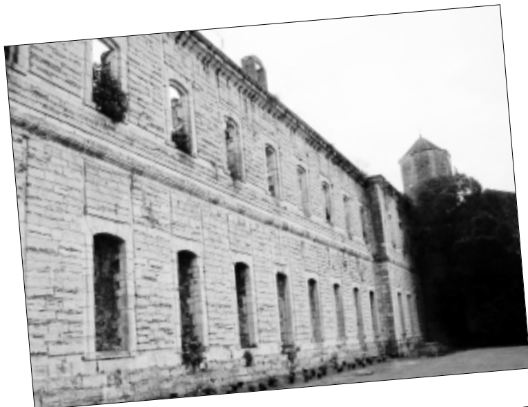
Partie de l'Abbaye Saint-Jean de Sorde

Notre Assemblée Générale (alternance oblige), après Bidache, s'est déroulé tout le samedi 24 mars 2007 à Sorde l'Abbaye.